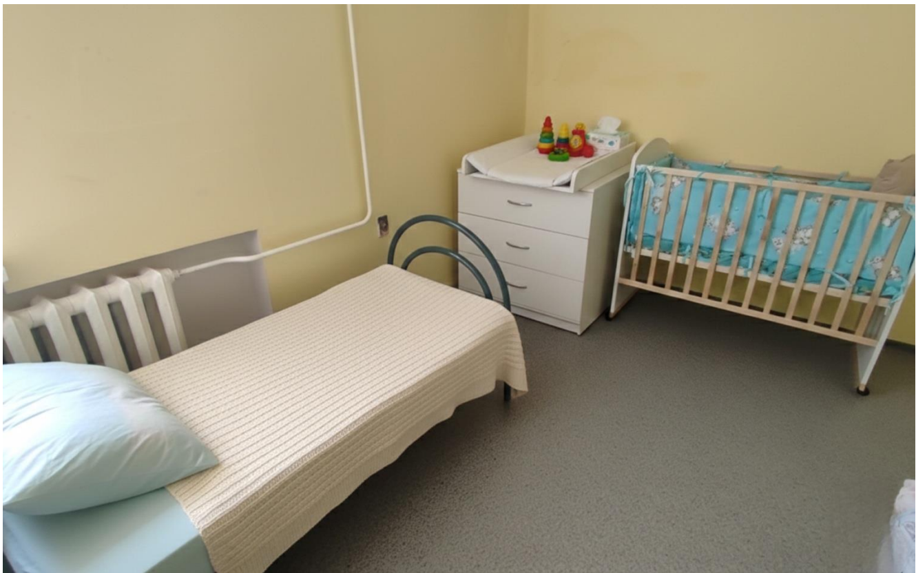
«Мать и Дитя»